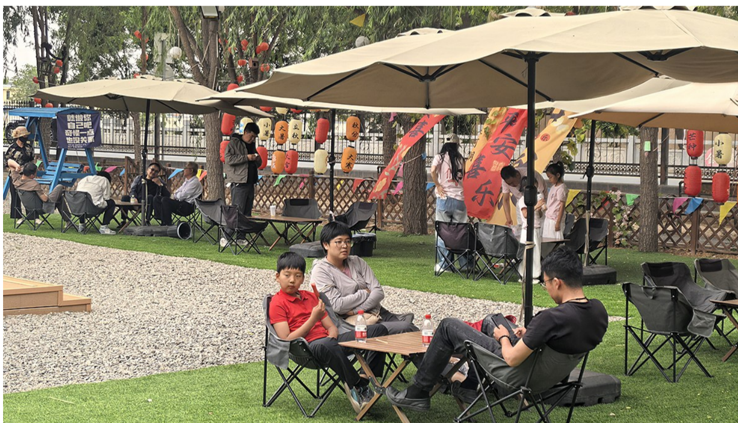
5月27日,在吴忠董府景区董营·福里营地,市民乐享假日时光。

本报讯(记者 洪蓉 李金汰)假期期间,吴忠市各大景区景点推出沉浸式文旅体验活动,叠加多项惠民让利举措,全市文旅市场持续升温,游客接待量稳步增长,假日文旅经济活力充分释放。