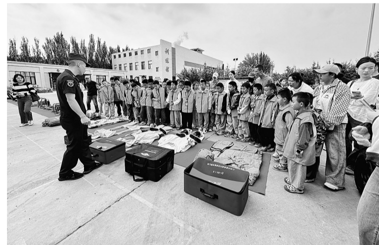
5月16日,在吴忠市“行知小记者”研学活动中,小记者学习消防知识、体验消防技能。

本报讯(见习记者 盛佳琪)5月16日,吴忠市“行知小记者”研学活动走进市消防救援支队欣荣街特勤站。小记者们学习消防知识、体验消防技能,采访消防救援人员,开启了一场别开生面的消防安全之旅。