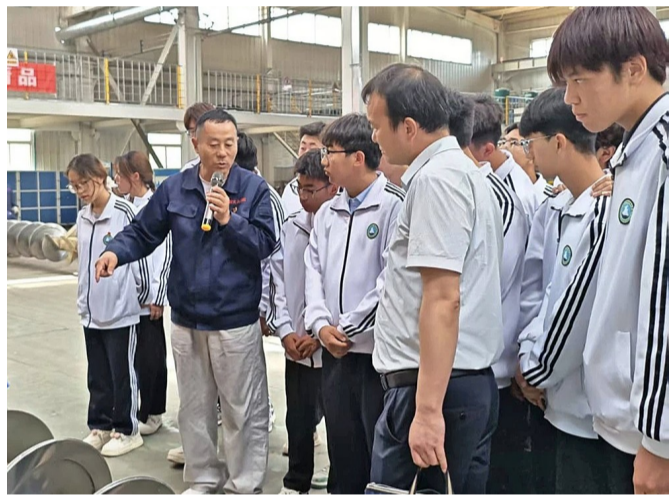
5月13日,宁夏民族职业技术学院智能制造学院组织学生代表前往宁夏新大众机械有限公司开展实地研学实践活动。