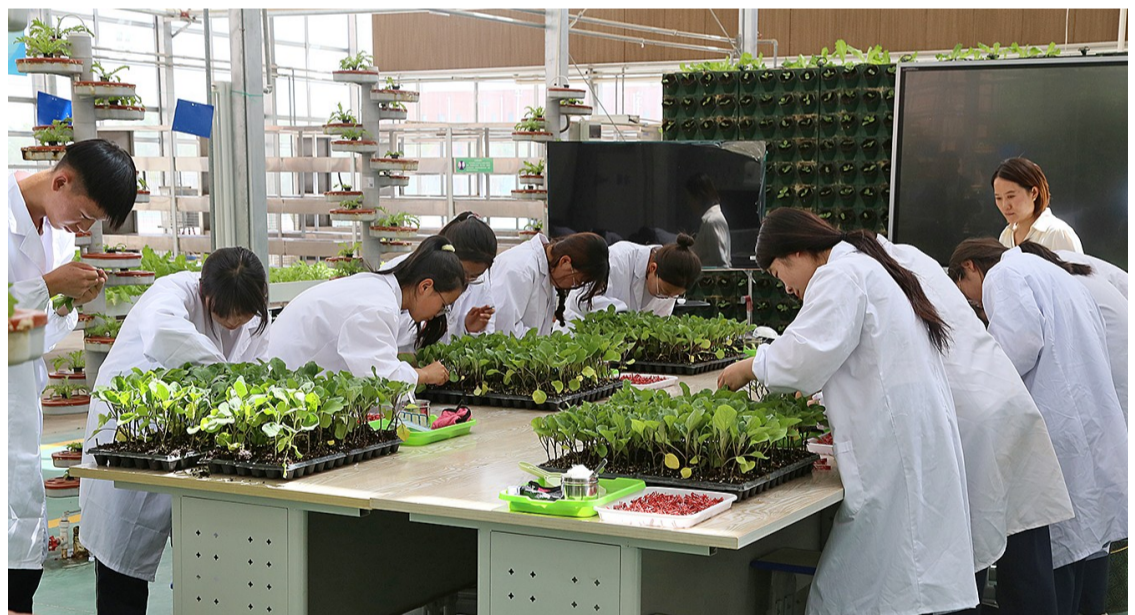
5月12日,吴忠市红寺堡区职业技术学院学生对育苗盘里的幼苗进行日常养护。