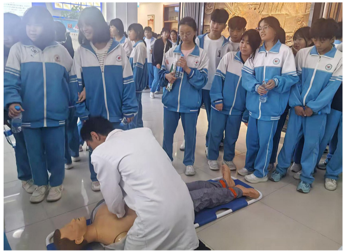
5月14日,同心县职业技术学校开展校园开放日活动。该校教师为同心县第五中学、第六中学学生演示心肺复苏。