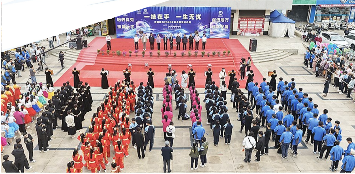
5月13日,青铜峡市2026年“一技在手 一生无忧”职业教育活动周启动仪式在该市古峡广场举行。