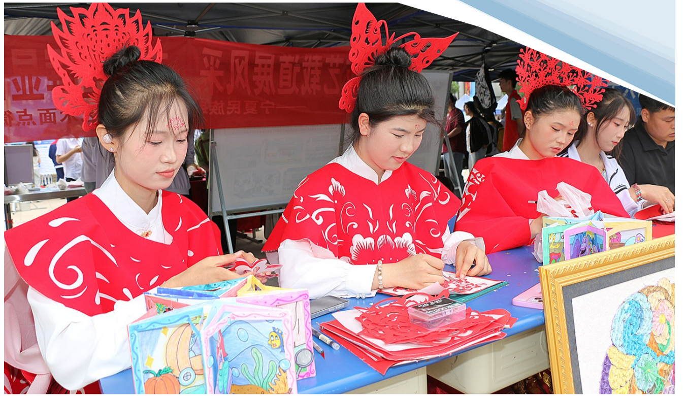
5月15日,宁夏民族职业技术学院人文教育学院学前教育专业的学生运用非遗剪纸技艺,开发幼儿园剪纸类玩教具。