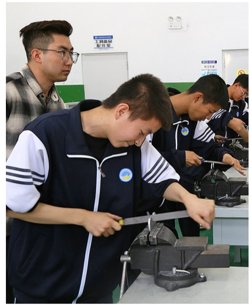
5月12日,吴忠市红寺堡区职业技术学院学生在实训台前,用锉刀对固定在台虎钳上的金属条进行加工。

从专业技能到民生服务,从课堂实训到产业赋能,我市职业教育活动周以多元活动诠释了“一技在手、一生无忧”的时代内涵,让大众认识到职业教育的价值与温度,为地方经济社会高质量发展注入强劲的职业教育力量。