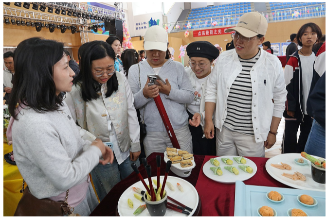
5月13日,同心县职业技术学校开展专业技能实操实训成果展示,美食展示是其中的特色环节。