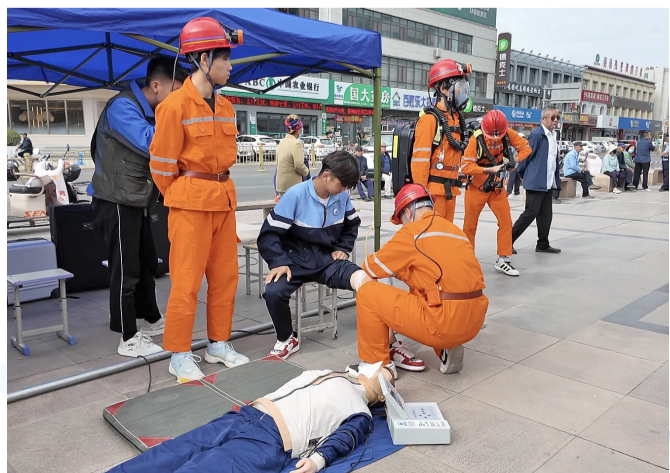
5月13日,在青铜峡市古峡广场,青铜峡市职业教育中心学生进行伤员急救演练。