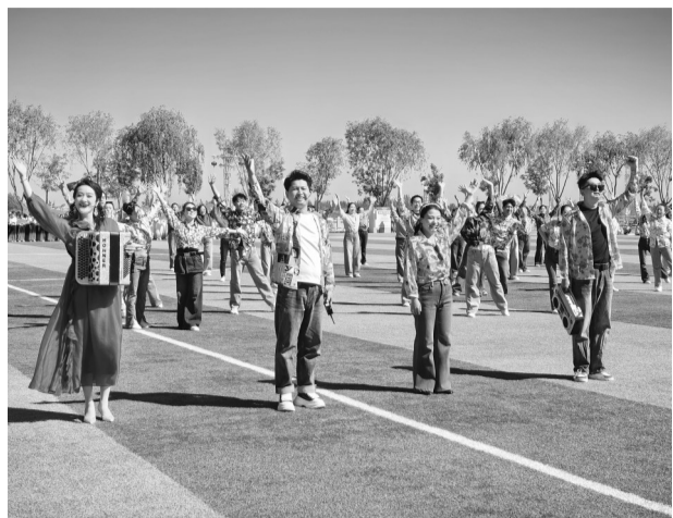
4月29日,演员们表演年代秀《金梭银梭》。