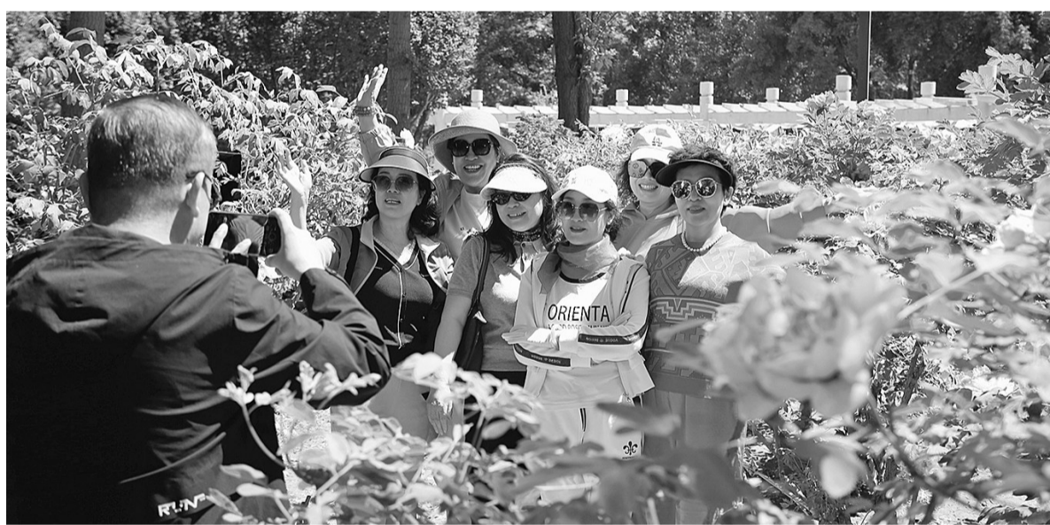
4月29日,游客在青铜峡市青秀园拍照打卡。

本报讯(记者 周志敏 邹丽)4月29日,“花开青铜峡·寻味牡丹香”第九届牡丹花会暨文旅促消费活动在青铜峡市青秀园文化广场开幕。