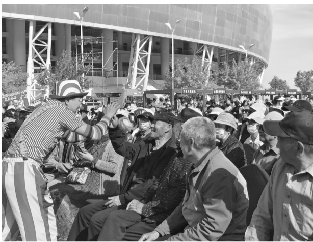
4月28日,小丑演员与现场观众互动。

商贸、餐饮等优质资源,推出“早茶飘香品鉴”“特色烧烤狂欢”“千人豆腐盛宴”等六大主题特色活动,全方位解锁多元假日游玩新体验。同步落地“乐享古峡·票根有礼”惠民促消费专项行动,游客凭机票、火车票、景区正规门票等有效出行游玩票根,即可现场申领餐饮住宿、特色葡萄酒等专属惠民优惠券。叠加好物以旧换新展销、多轮幸运抽奖互动环节,免费派送文旅消费券、群星演唱会门票、优质农特产品暖心礼包;联动全域星级酒店、特色餐饮商户推出“订房赠游玩门票”“消费满额兑门票”叠加福利,让广大市民游客一站式畅享美食、乐享文旅、尽享实惠。