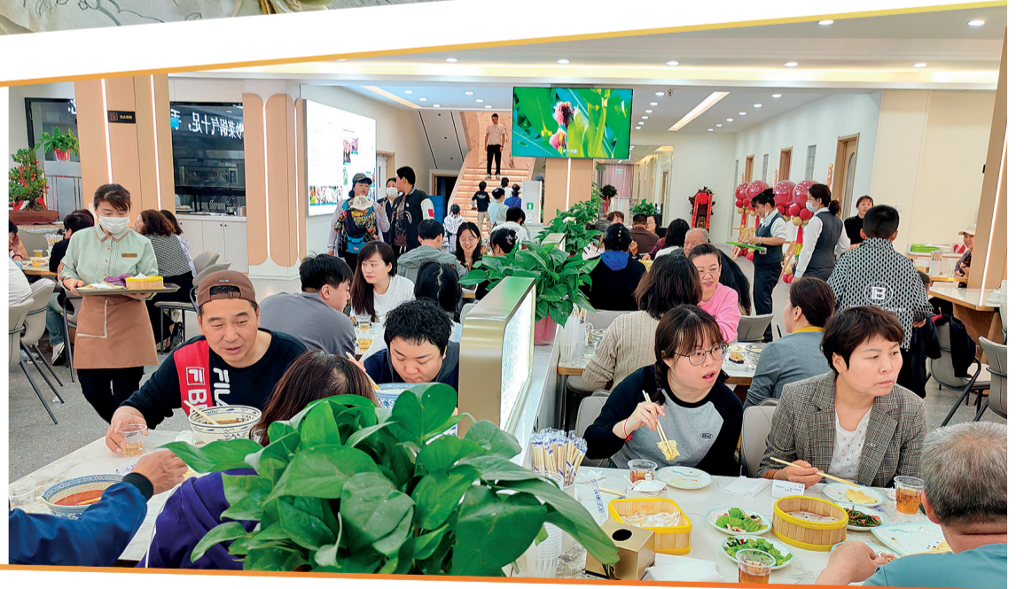
4月19日,青铜峡市一家早茶店里座无虚席。