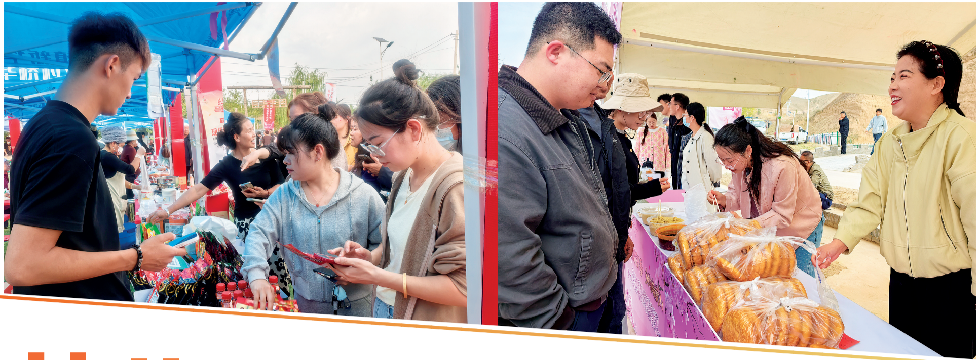
在盐池县麻黄山乡休闲农业乡村旅游促消费活动中,面点师傅向游客介绍自家炸的油饼(摄于4月13日)。