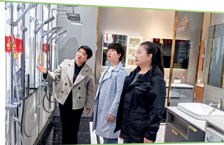
4月19日,市民在凯悦家居商场选购花洒。