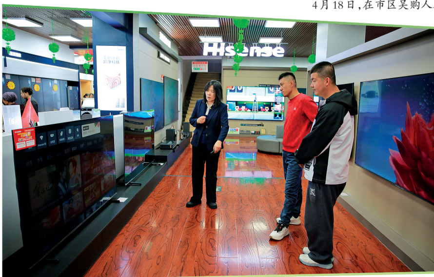
4月20日,市民在吴忠市信邦电器有限公司卖场选购电视机。