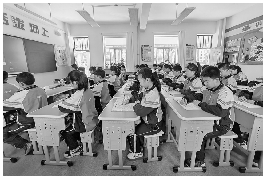
青铜峡市第三小学学生使用新课桌椅(摄于4月2日)。

青铜峡市教育局局长李培虎表示,将持续推进教室护眼灯全覆盖工程,确保所有教室光照符合国家中小学教室照明标准。同时,加快推进剩余班级可