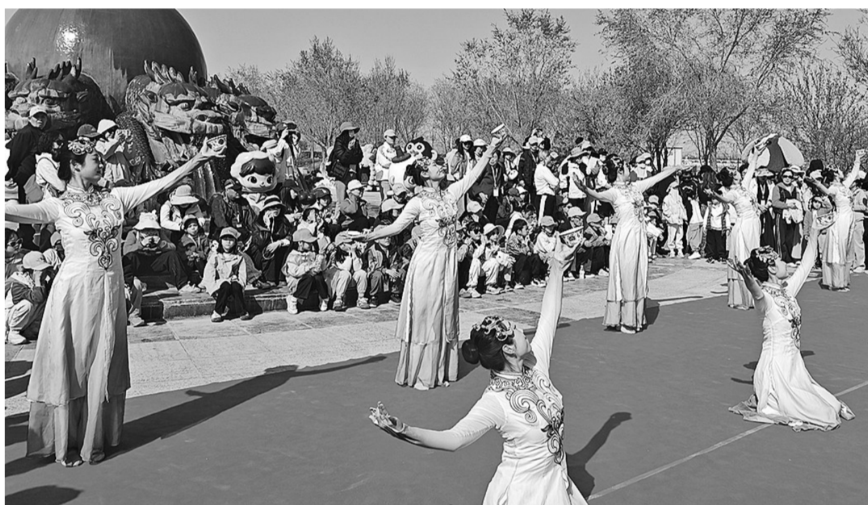
4月4日,在青铜峡黄河大峡谷旅游区,来自四川的游客欣赏迎宾演出。

本报讯(记者 锁冰心 丁宝萍 见习记者 董泊麟 马佳欣)4月3日至4日,500多名四川游客搭乘“吴忠号”熊猫专列奔赴吴忠市,开启一场春日研学与文旅体验之旅,在欣赏山河美景、品尝特色美食、了解民俗文化中感受吴忠的独特魅力。