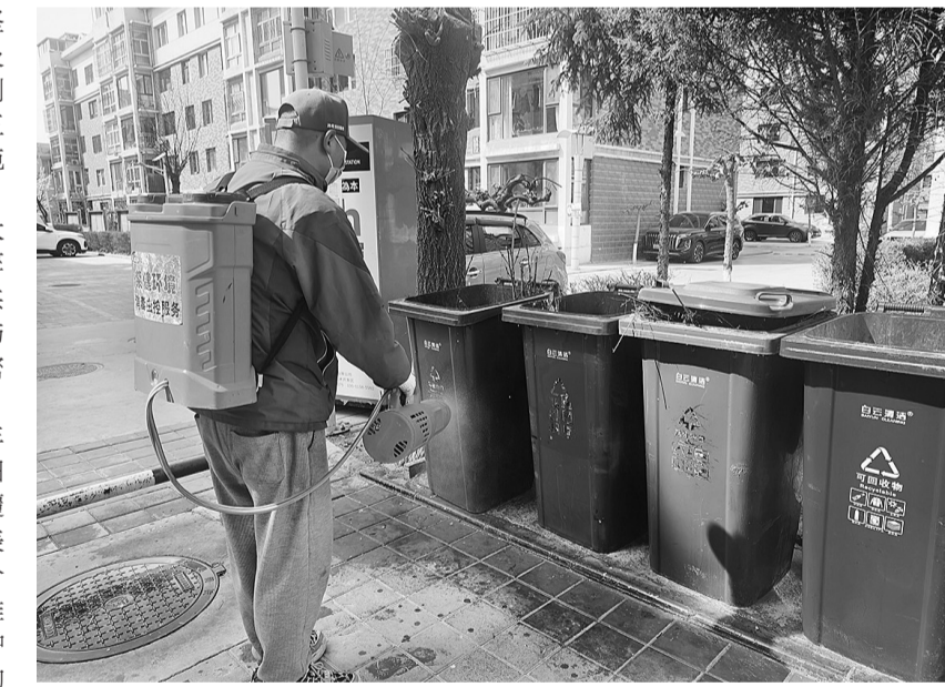
3月25日，在吴忠市区世纪嘉园小区，工作人员对垃圾桶进行消杀。

此次春季病媒集中消杀工作较往年覆盖面更广、针对性更强，重点聚焦老旧小区、无物业小区等关键区域。目前已覆盖城区26个社区、359个小区。周兆娟表示，将继续根据病媒生物活动规律，分阶段、分区域持续推进消杀工作，通过精准发力、多措并举，全力筑牢卫生健康防护屏障，为群众营造一个健康、整洁、舒适的生活环境。