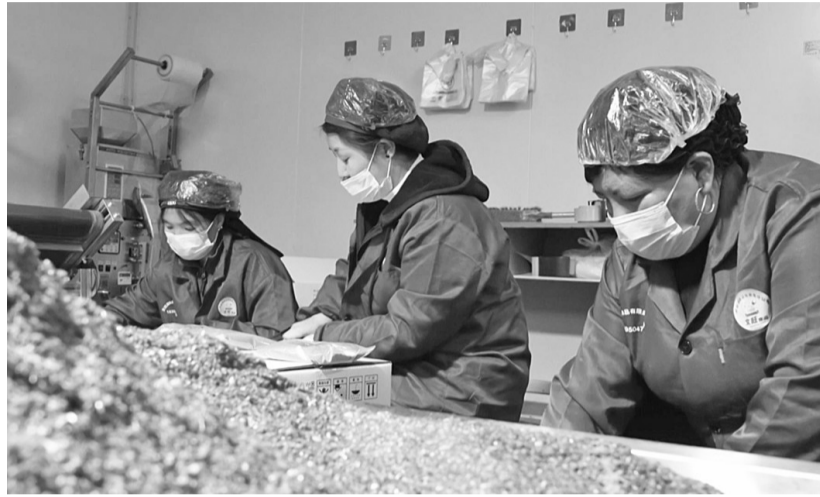
在宁夏文旺食品有限责任公司务工车间，工人正在包装调味品(摄于3月20日)。

“我们主要生产炖肉料、炒菜料、麻辣料、烧烤料等各类调味品，同时采取就近用工、免费技能培训的模式，助力村民稳岗增收。目前，车间已带动