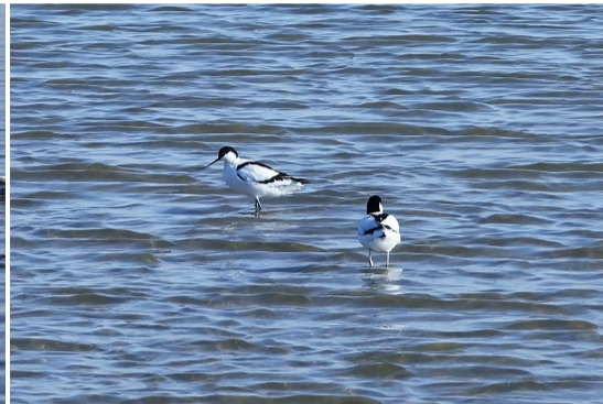
身着黑白“熊猫装”的反嘴鹬。