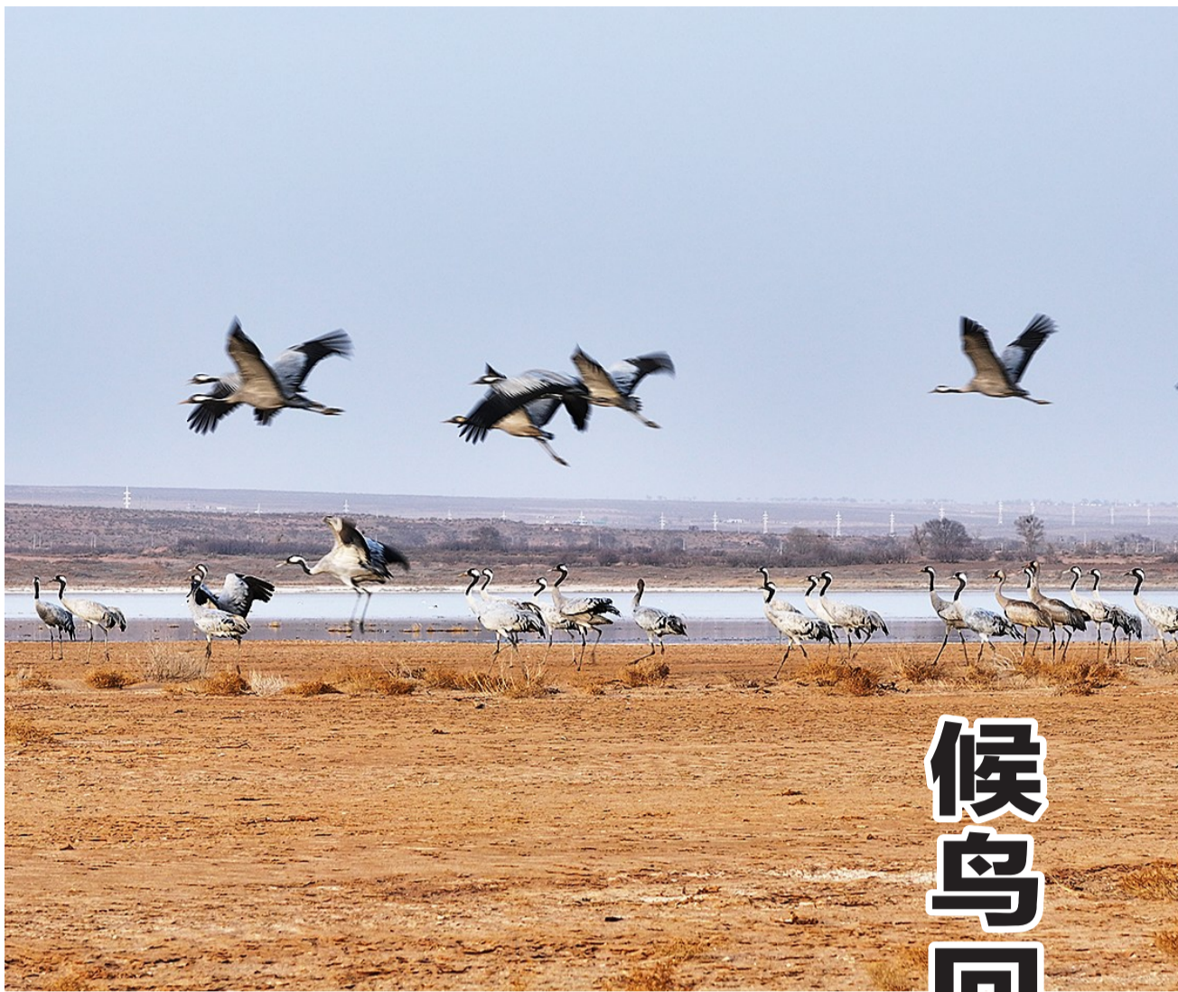
成群的灰鹤或扎堆歇息,或在空中翩翩起舞。