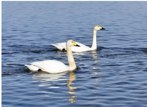
小天鹅在水中自在游弋。