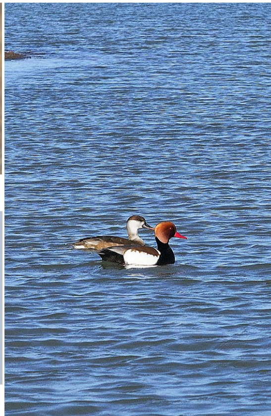
赤嘴潜鸭结伴同游。