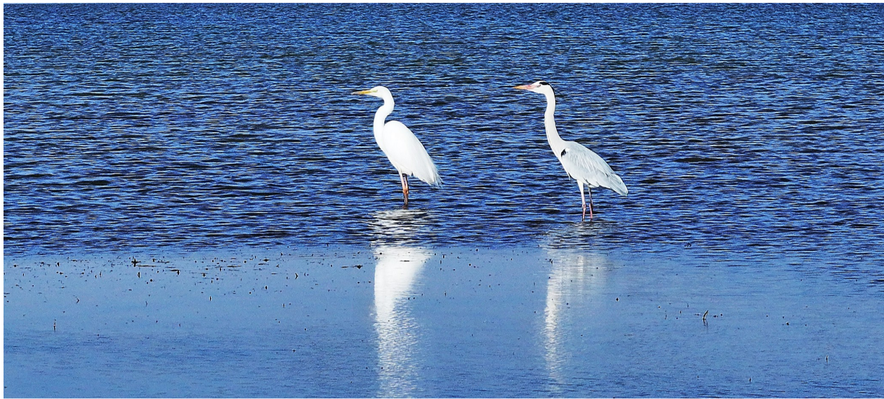
优雅的苍鹭。