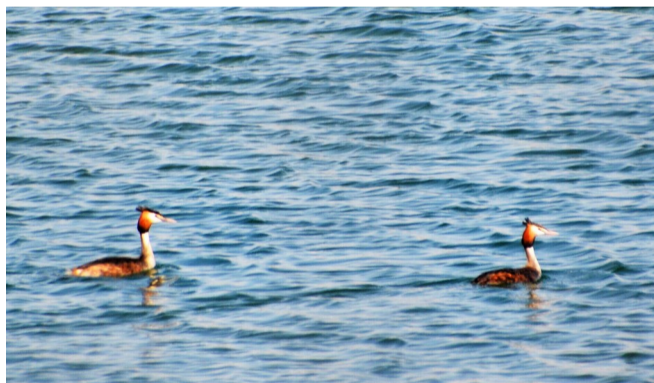
成双成对的风头鸭悠然畅游。