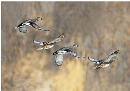
赤膀鸭自由翱翔。