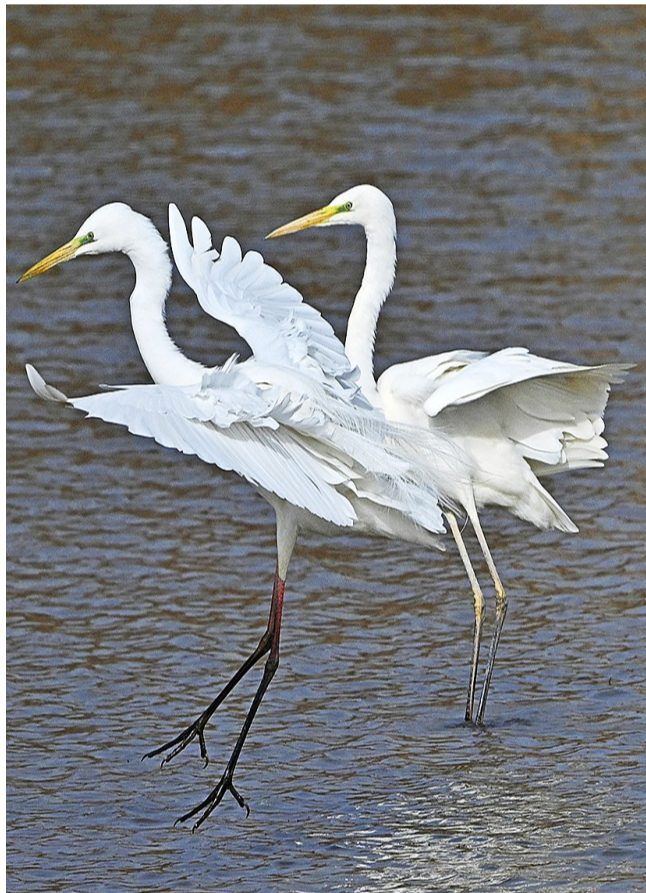
一只大白鹭振翅欲飞。

近年来,吴忠市坚定不移走生态优先、绿色发展之路,持续加大湿地保护与生态修复力度,全域生态环境质量稳步提升、持续向好。得益于生态底色的不断擦亮,迁徙过境吴忠的候鸟种类逐年递增,越来越多的候鸟选择在此停歇补给、栖息繁衍,为这座黄河岸边的城市注入了满满的灵动生机。