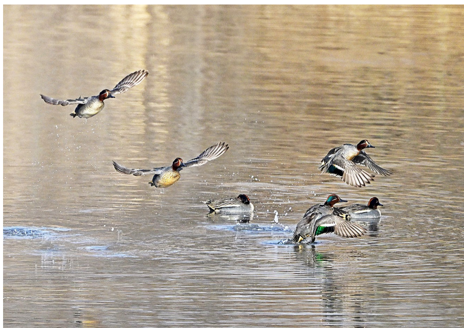
绿翅鸭在水中振翅嬉戏。