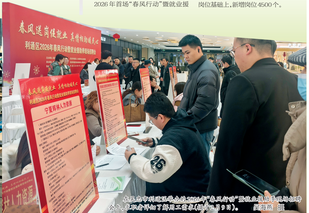
在吴忠市利通区举办的2026年“春风行动”暨就业援助会上,求职者详细了解用工需求(摄于2月9日)。