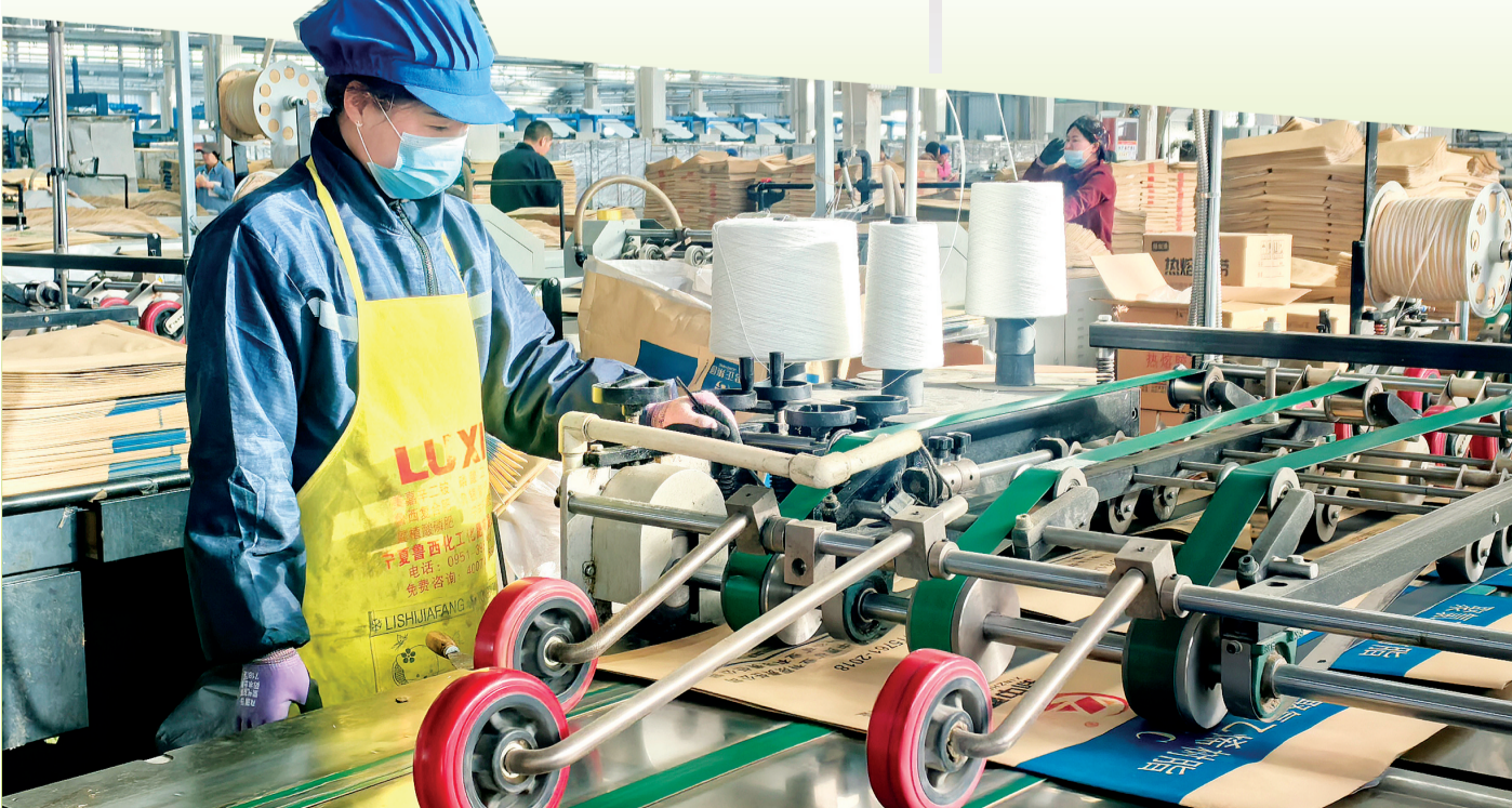
在吴忠市东星塑料制品有限公司年产3万吨绿色智能包装产业园生产车间里,工人紧盯设备运行状态,把控每一道生产工序(摄于3月6日)。

从“敲门入户”的精准摸排,到“数据找人”的贴心服务,我市正推动社保补贴、稳岗返还等“政策礼包”精准滴灌。据统计,今年以来全市已通过“免申即享”等模式,为各类市场主体和重点群体送去资金支持超千万元,力争全年落实社保降费减负、稳岗返还等补贴资金5.5亿元,确保在稳定14.5万个企业用工岗位基础上,新增岗位4500个。