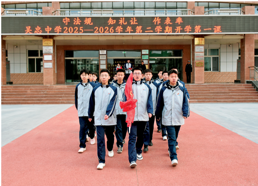
3月2日,吴忠中学举办“开学第一课”升国旗仪式。