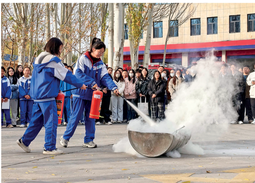
3月2日,吴忠市红寺堡区第一中学组织学生走进红寺堡区消防救援大队,学习灭火器操作。