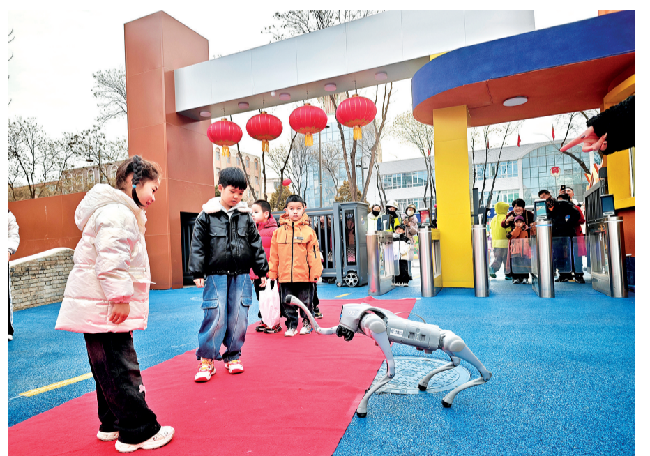
3月2日,吴忠市利通区第一幼儿园用智能机器人迎接幼儿入园。