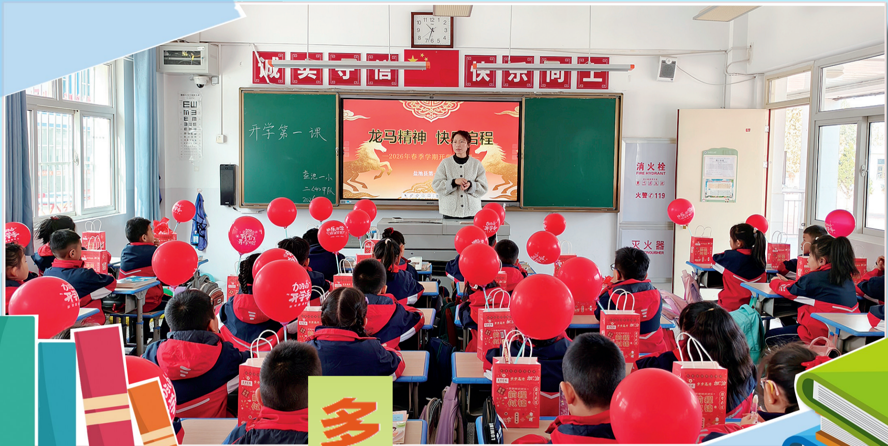
3月2日,盐池县第一小学以“龙马精神 快乐启程”为主题,精心开展系列“开学第一课”活动,将龙马精神与红色教育、习惯养成、实践体验深度融合,开启充满力量与希望的新学期。