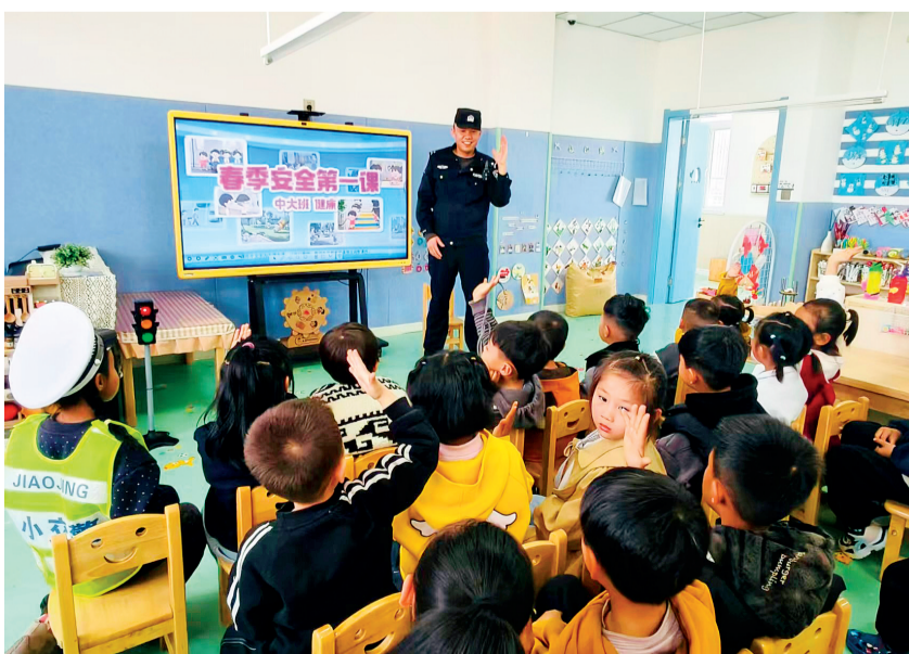
3月2日,同心县第六幼儿园邀请民警走进教室,以生动有趣的方式为萌娃们讲授安全“开学第一课”。