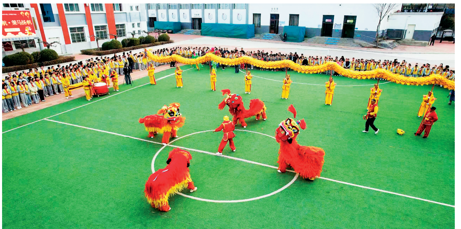
3月2日,吴忠市利通街第一小学邀请舞龙舞狮队走进校园,以一场热闹喜庆的民俗表演,为全校师生送上别开生面的“开学第一课”。