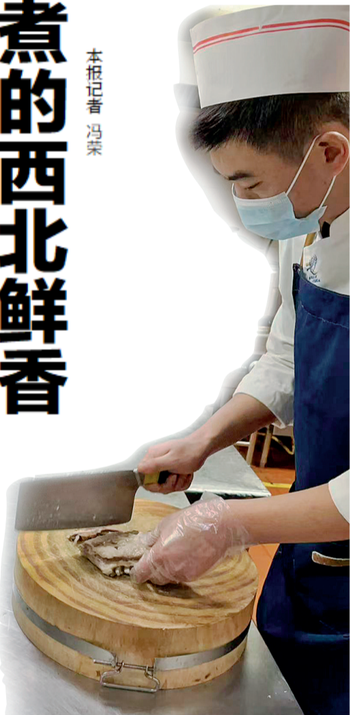
盐池宾馆的厨师正在切手抓羊肉。

一碗清水,一把好盐,几分香料,厨师用朴素的烹饪方式,激活了盐池滩羊的极致风味。它不仅是一道菜,更是盐池地域文化的载体,见证着传统美食在时光中的传承与绽放。