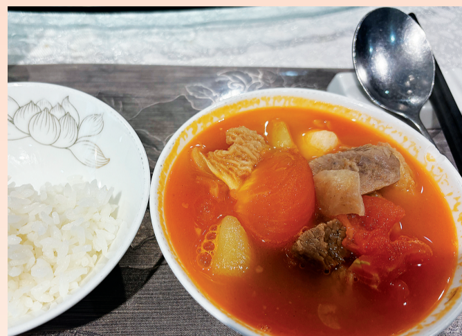
酸甜开胃的西红柿炖牛腩,牛腩软烂入味,汤汁拌饭超赞。

说起家常硬菜,西红柿炖牛腩绝对能排进“家庭人气榜”。软嫩不塞牙的牛腩裹着酸甜浓郁的汤汁,无论是配米饭还是拌面条,都能让人忍不住多吃两碗。