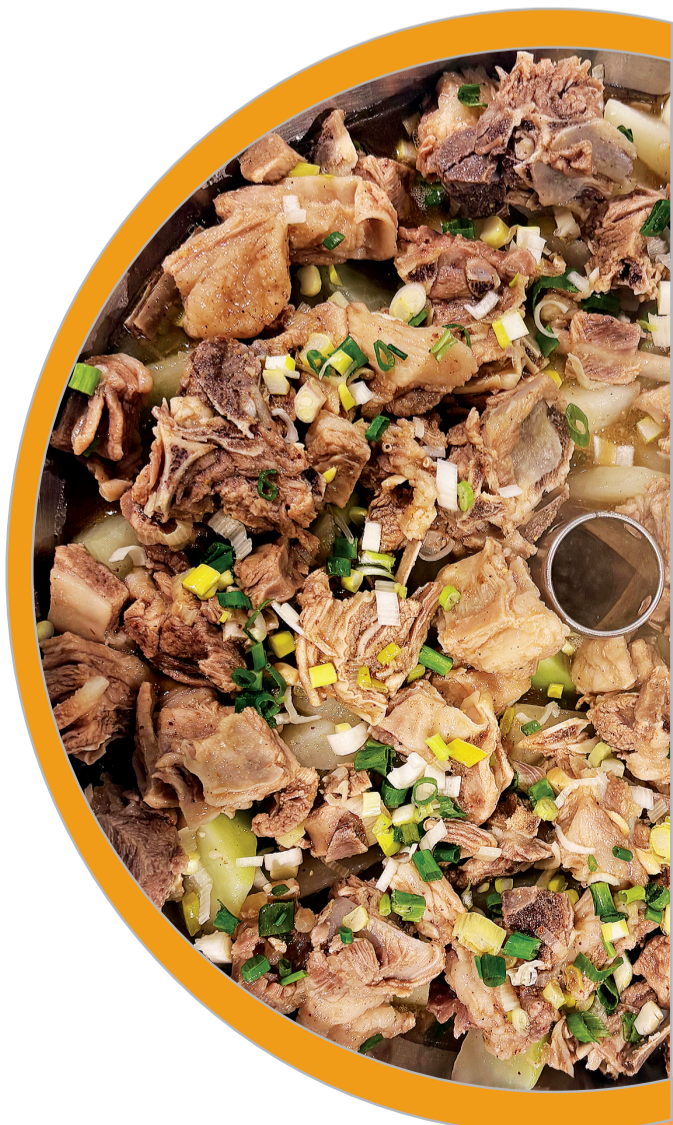
鲜香入味的汽锅羊肉。