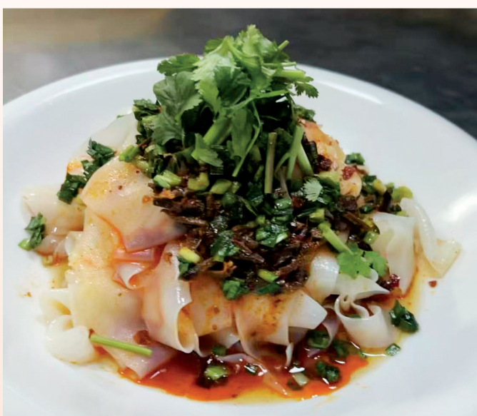
鲜红的辣油、翠绿的香菜、褐色的羊肝,每一口盐池羊肝凉皮都是享受。

羊肝凉皮作为盐池县传承多年的传统特色美食,以其筋道的凉皮、秘制的羊肝酱、酸辣鲜香的独特口感,成为无数人心中割舍不下的家乡味道。