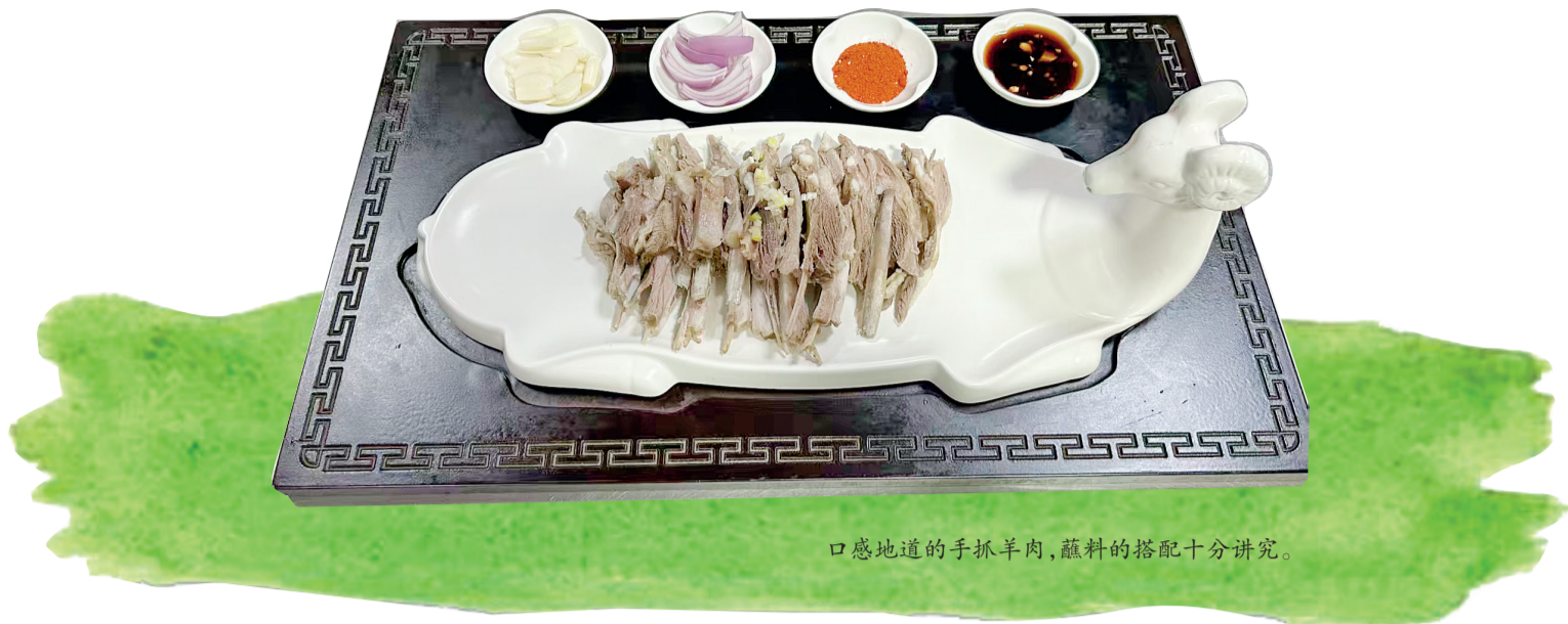
口感地道的手抓羊肉,蘸料的搭配十分讲究。