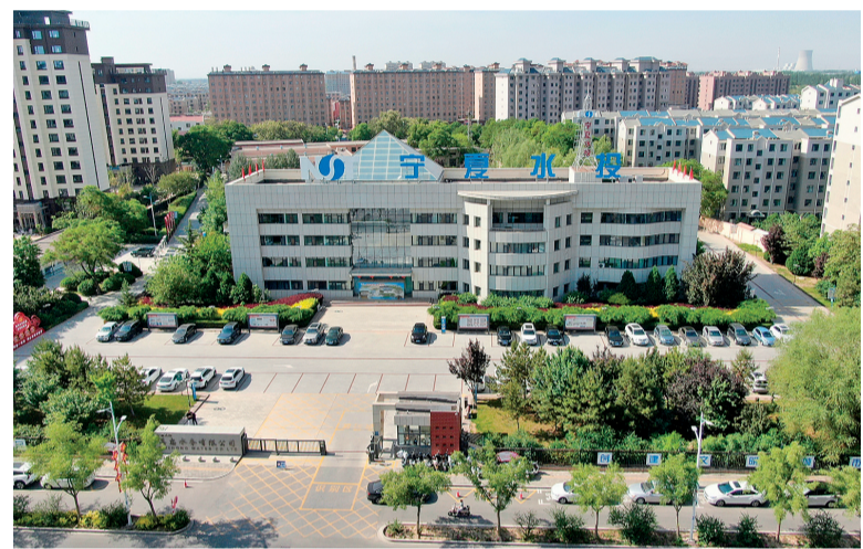
吴忠水务公司本部。

吴忠水务公司创建的“合同节水+水权交易”机制获得乐水杯2024年基层十大治水经验,利通区“四水四定”经验做法入选第六批全国干部学习培训教材。“多源数据融合赋能灌区需求预测项目”获得数据要素大赛宁夏分赛现代农业赛道优秀奖。