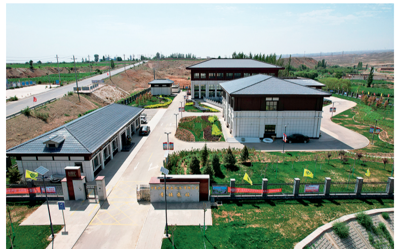
银川市都市圈城乡东线供水工程——青镇泵站。