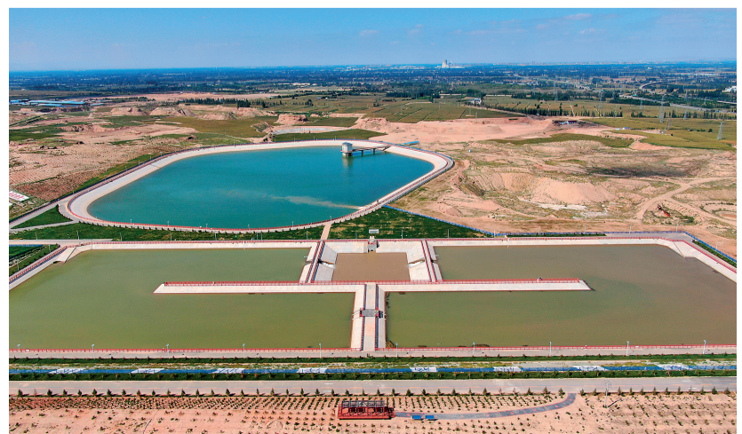
银川市都市圈城乡东线供水工程——三星塘水库。

从调度中心眺望,万家灯火与汨汨清流交相辉映。这家成立7年的国企,正以水为笔,继续在这片土地上书写着保障民生、服务发展的时代新篇。