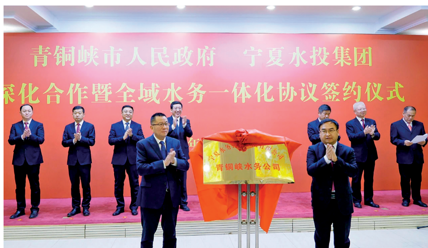
青铜峡市实现全域水务一体化。